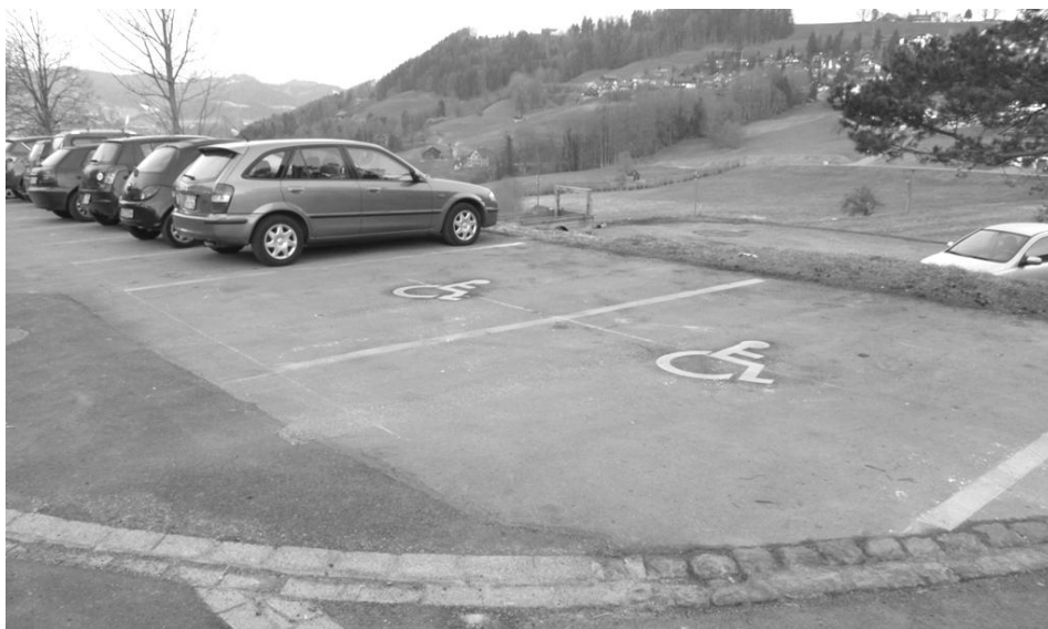
Neuerstellte Behindertenparkplatze auf dem Gemeindeparkplatz Richtung Dietfurt