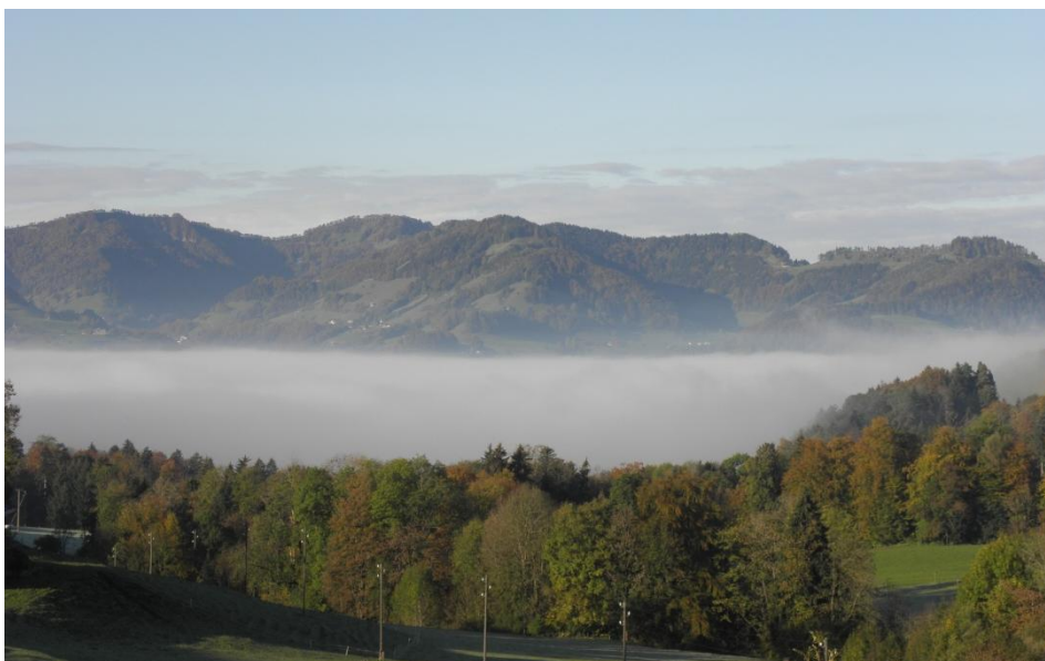
Blick auf das Nebelmeer uber dem Thurtal