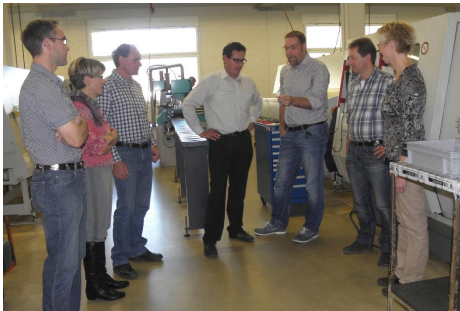
Der Gemeinderat zu Besuch bei der Mosmatic AG