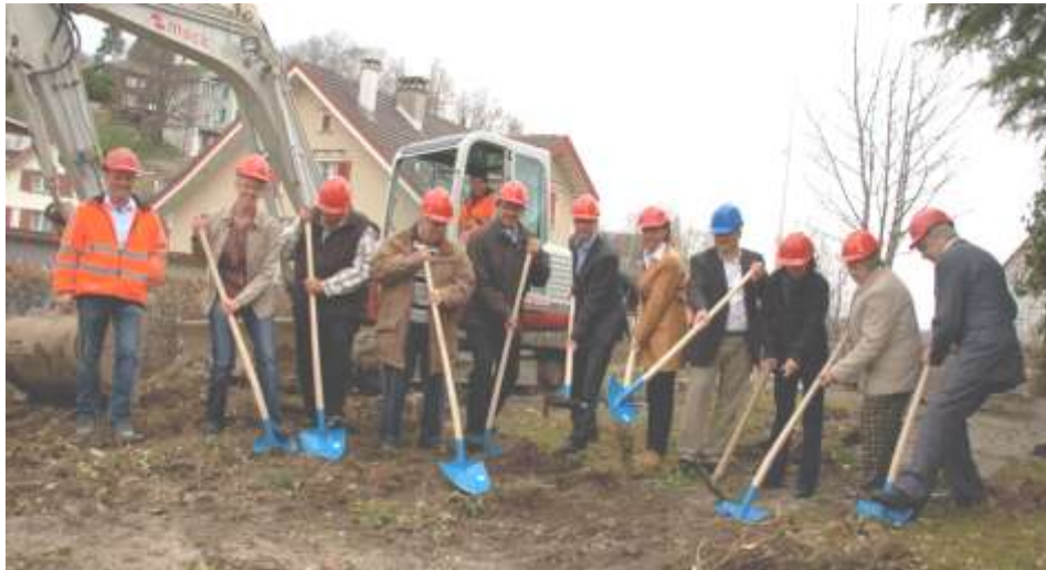
Spatenstich Erweiterung Dorfplatz vom 30. Marz 2012