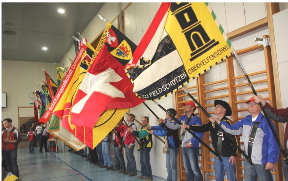
Absenden Feldschiessen 2013 in der Sonnenberghalle.