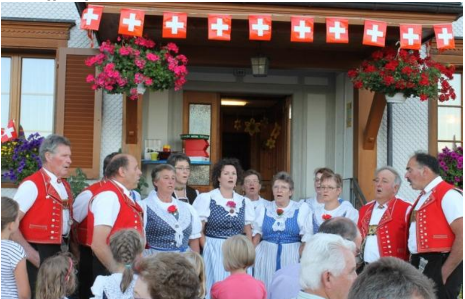
Bundesfeier mit dem Trachtenchorli Oberhelfenschwil