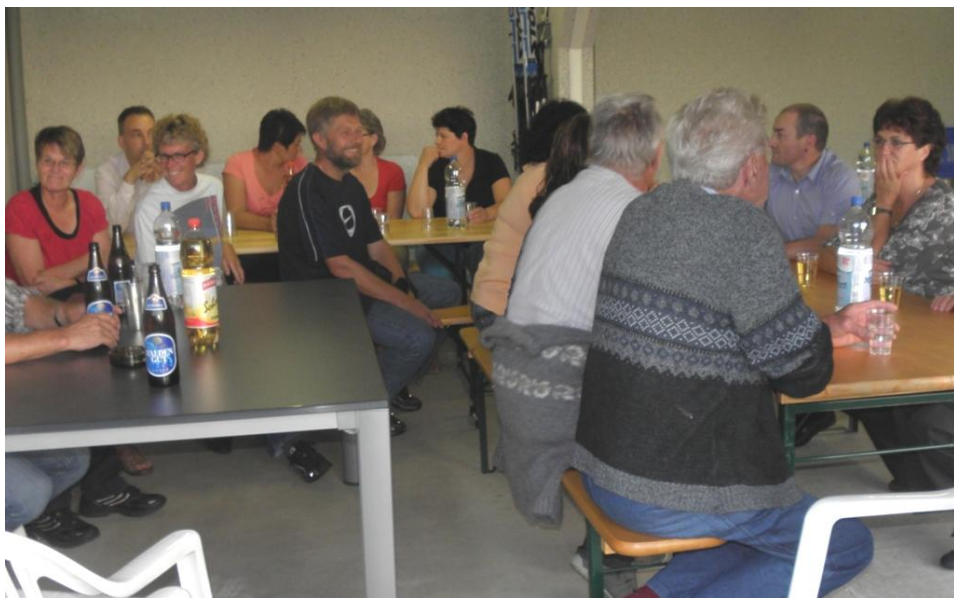
Gemutliches Beisammensein am Weilergesprach im Wigetshof.