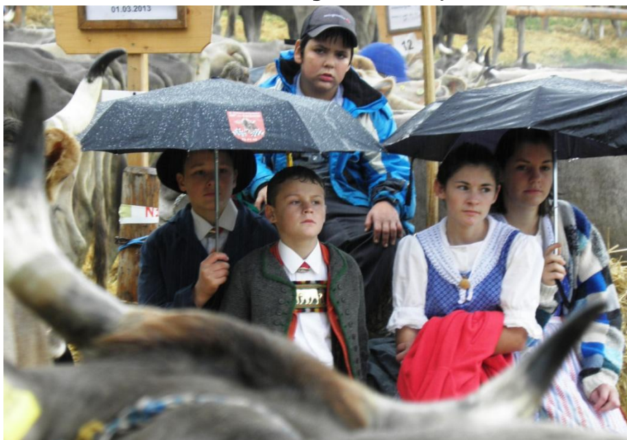
Vihschau 2013 in Oberhelfenschwil.