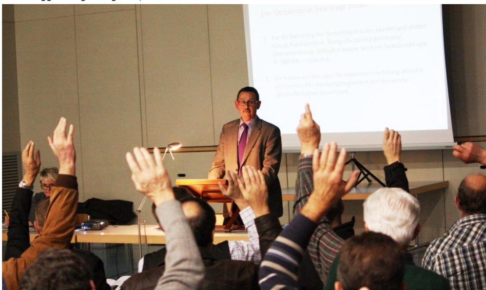
Das Budget 2014 wurde an der Burgerversammlung gutgeheissen.