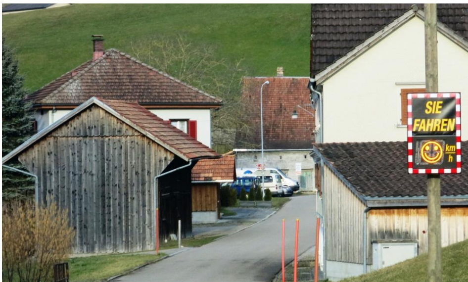
Neue Geschwindigkeitsanzeige im Wigetshof.