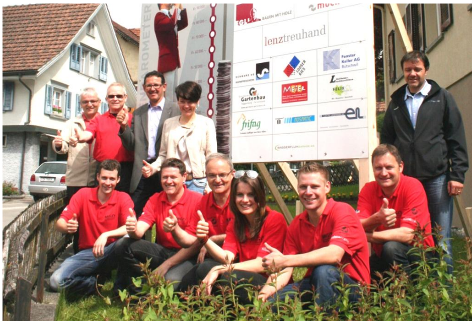
Die Musikgesellschaft startete zur Neununiformierung mit Einweihung des Spendenbarometers