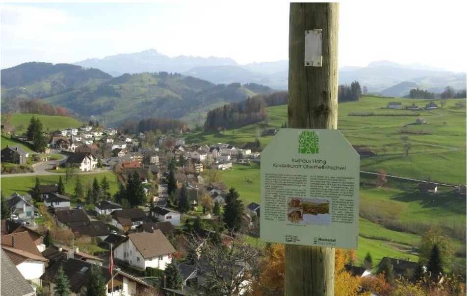
Info-Tafel auf der Wanderroute des neuen Kulturweges Oberhelfenschwil.