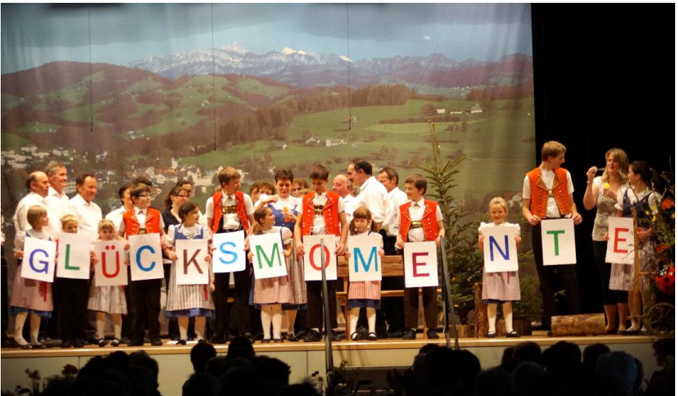
Glücksmomente – Motto der diesjahrigen Bauerinnentagung in Oberhelfenschwil