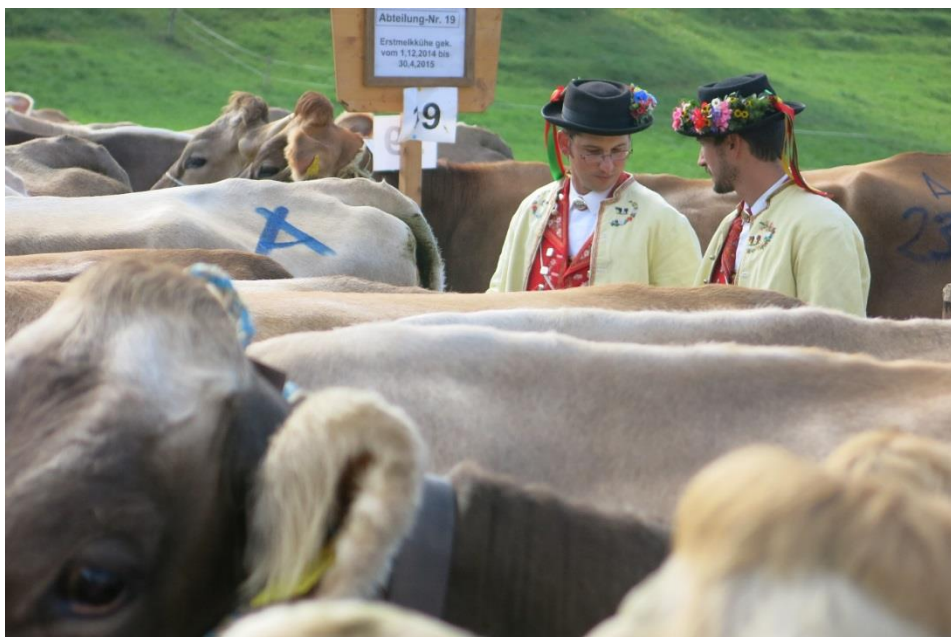
Oberhelfenschwiler Viehschau 2015