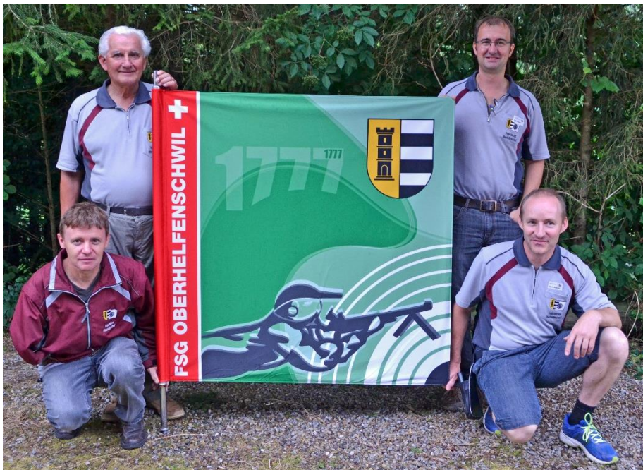
Die Feldschutzen mit ihrer neuen Vereinsfahne.