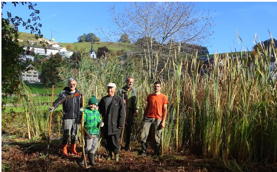
Der Natur- und Vogelschutzverein bei der Rosenweiherpflege.