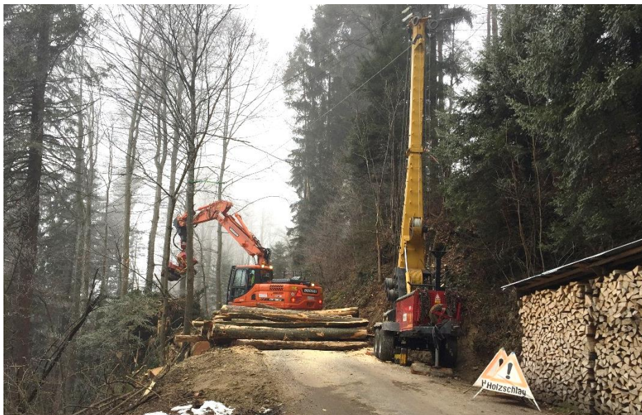
Holzschlag Vorderhalden (zwischen Graben und Wasserfluh)