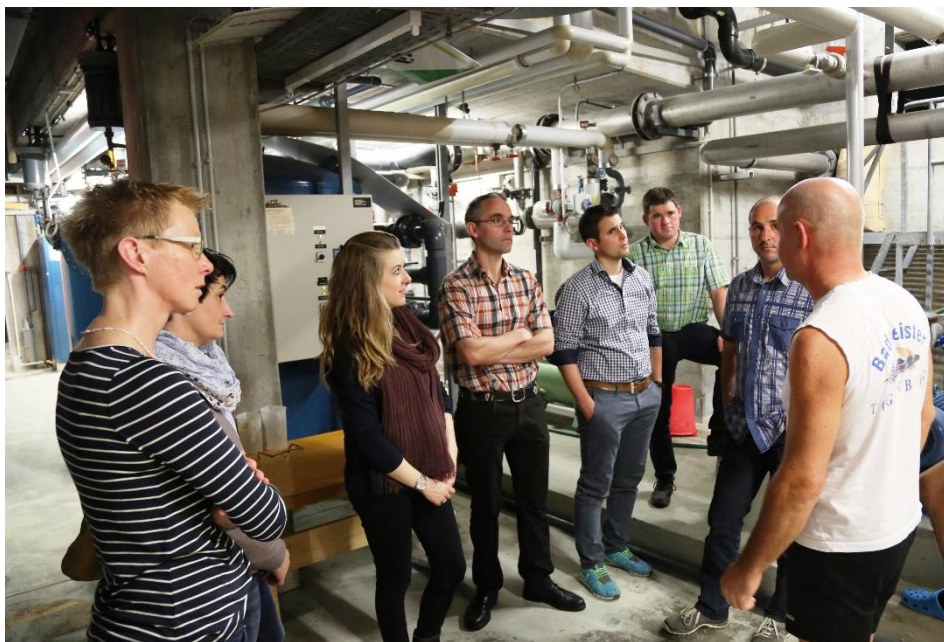
Gemeinderat zu Besuch im Hallenbad Butschwil