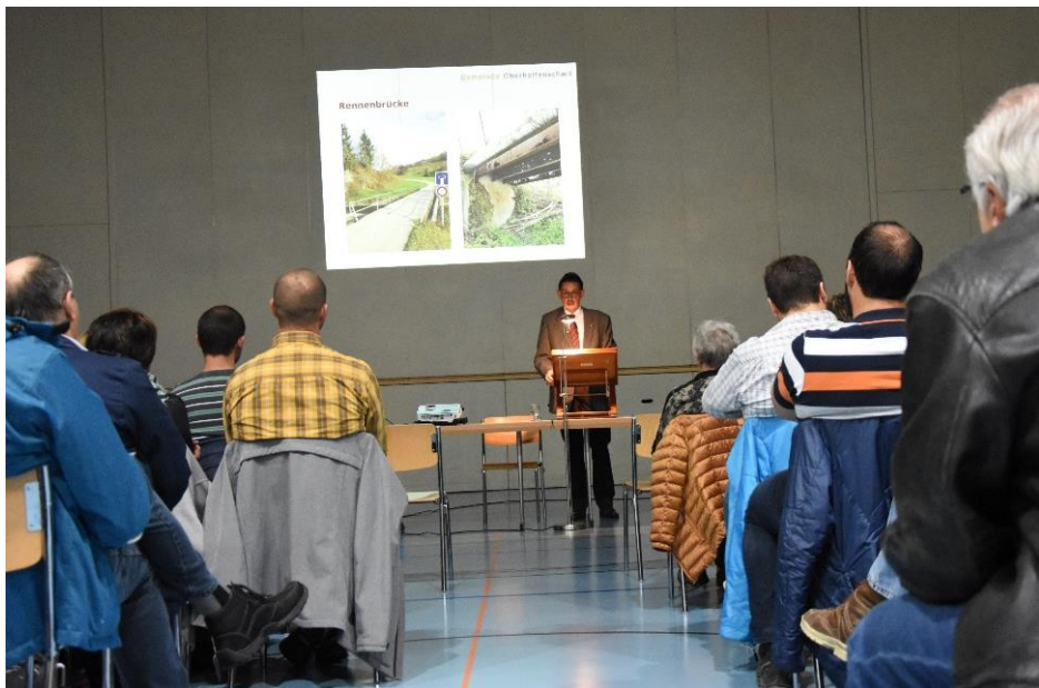
Burgerversammlung fur das Budget 2018