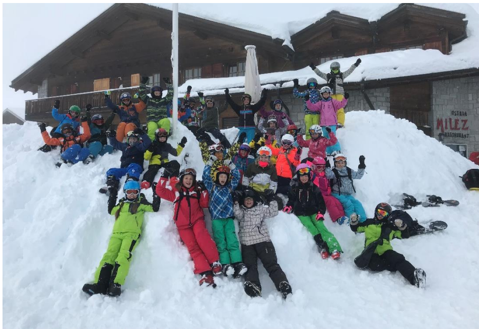
Schnee und Spass im Primarschul-Skilager 2018