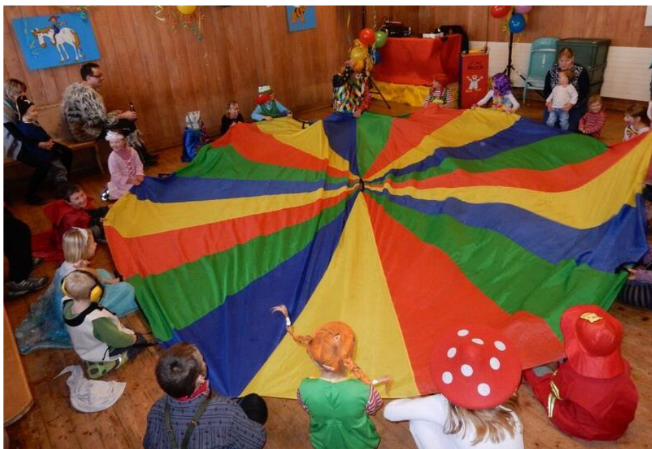
Cooler Kinderfasnacht mit Clown Muck auf dem Hohg