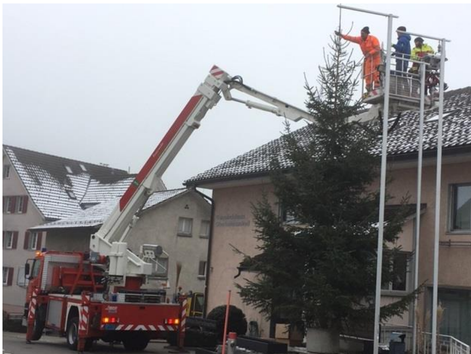
Christbaumschmucken mit Hubretter