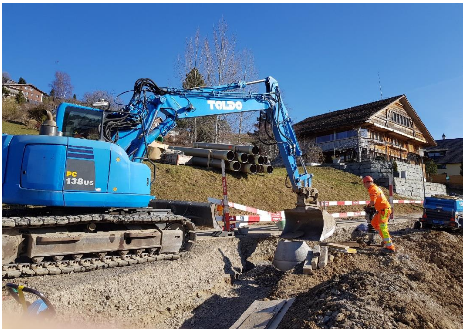
Bauarbeiten des Trennsystems an der Bogenstrasse