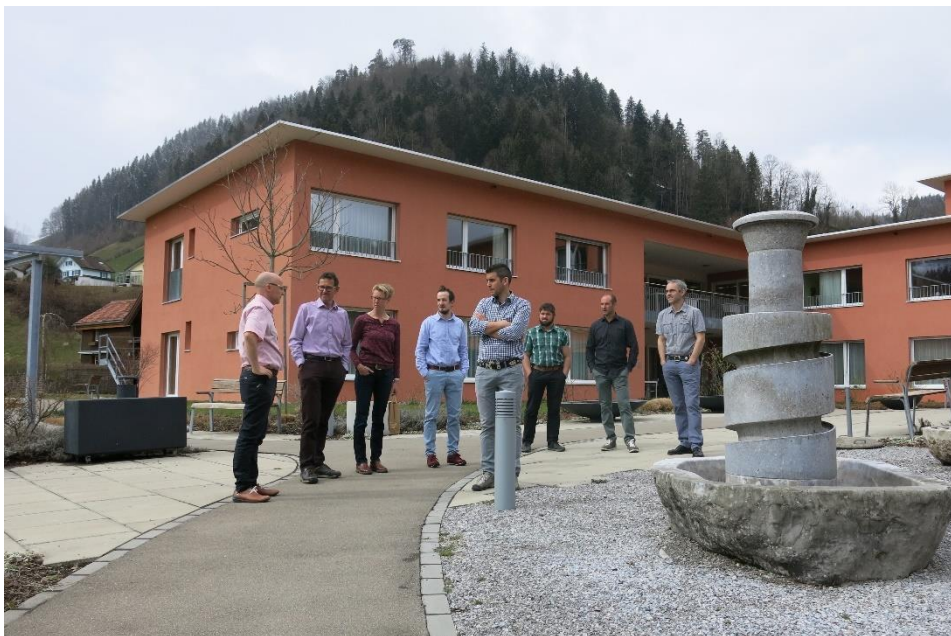
Besuch Gemeinderat im Seniorenheim Neckertal