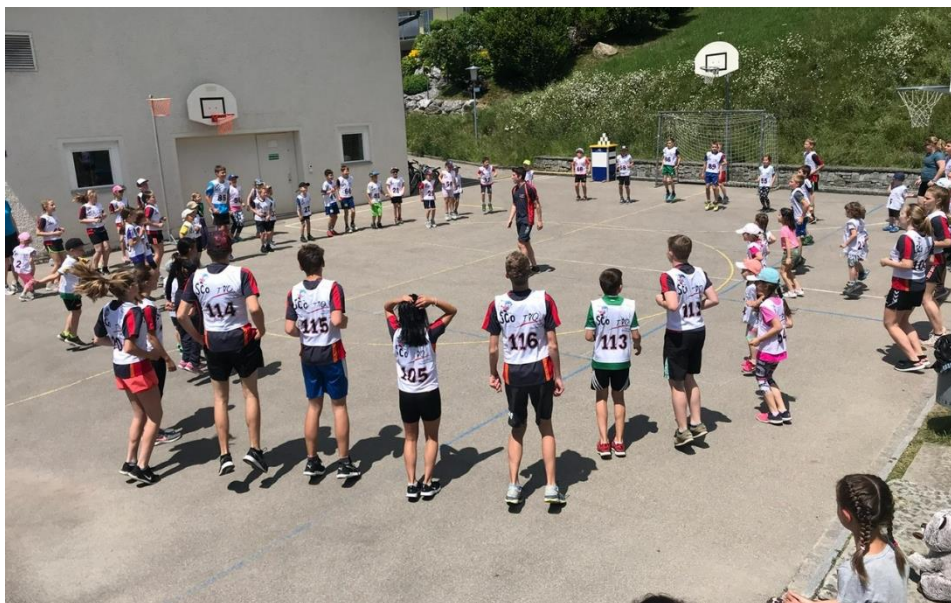
Rangturnen des Turnvereins Oberhelfenschwil