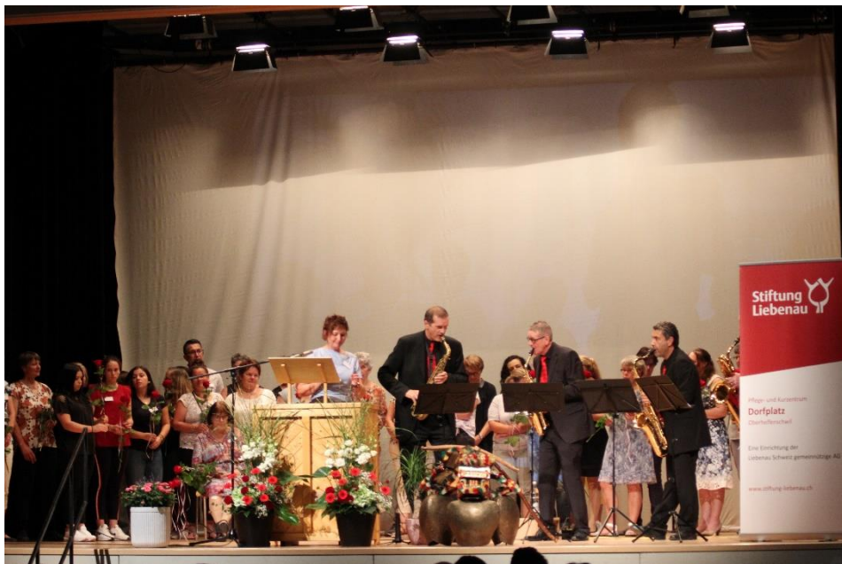
30-Jahr-Jubilaum Pflege- und Kurzentrum Dorfplatz