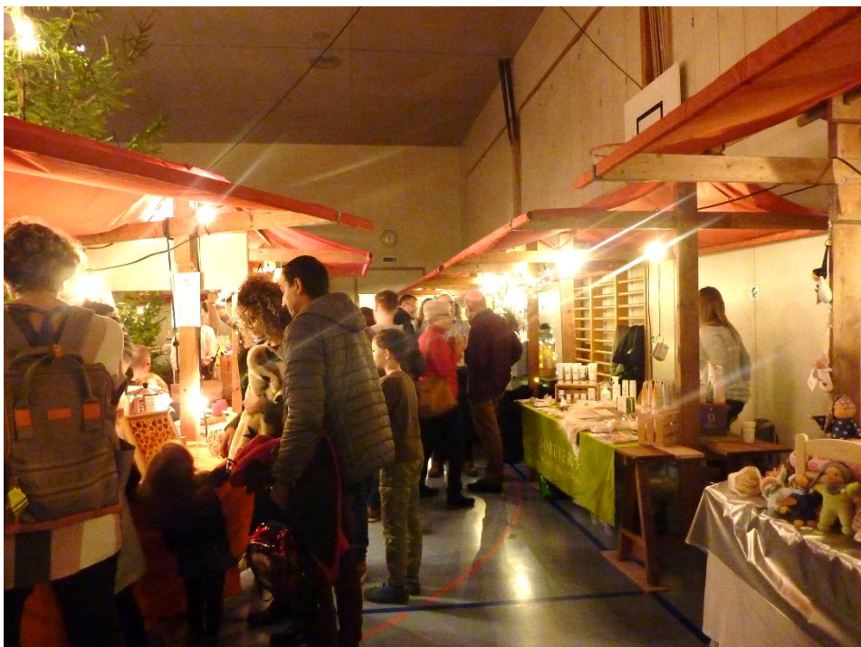
Weihnachtsmarkt 2019 in der Sonnenberghalle