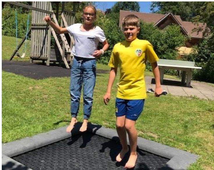
Neu: Bodentrampolin auf dem Spielplatz Feldwies